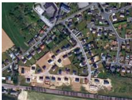
Vue aérienne prise en 2006

Ces deux vues aériennes prises à un intervalle de temps d'une dizaine d'années illustrent la manière dont le territoire s'urbanise progressivement au détriment des terres agricoles.