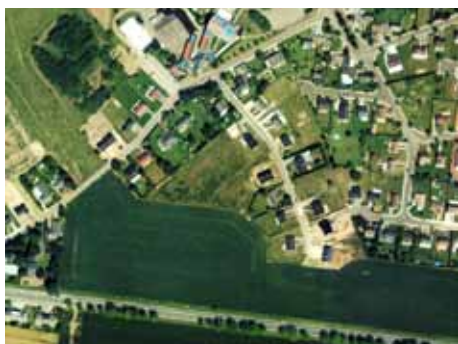
Vue aérienne prise en 1996